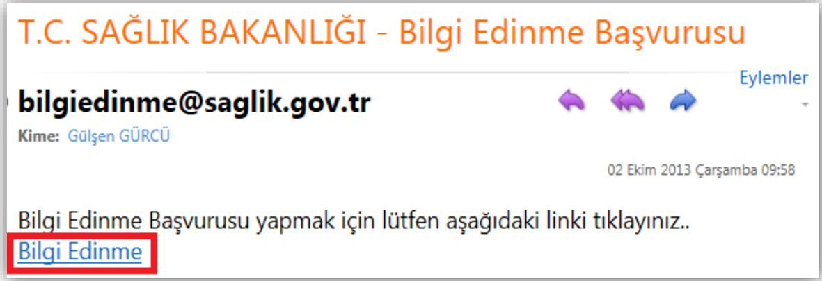
Şekil – 4. E-posta adresine gelen bağlantı

Sonraki adımda ise, Şekil – 3 de görülen mesaj ekrana geldiğinde, Bilgi Edinme Talep ekranında yer alan “E-POSTA” bölümünde belirtilmiş olan e-posta adresine ulaşılarak, Şekil – 4 de gösterildiği gibi bilgiedinme@saglik.gov.tr adresinden gönderilen postadaki “ Bilgi Edinme ” bağlantısına gidilir ve Elektronik Başvuru Arayüzüne ulaşılır.